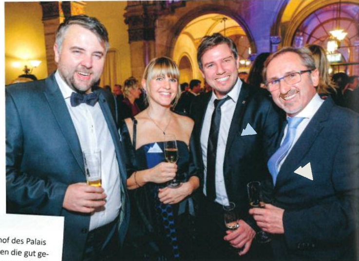
Im Arkadenhof des Palais Ferstel wurden die gut gelaunten Gäste empfangen.