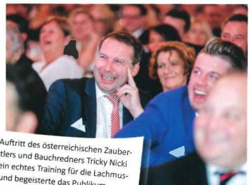
Der Auftritt des österreichischen Zauber-künstlers und Bauchredners Tricky Nicki war ein echtes Training für die Lachmuskeln und begeisterte das Publikum.