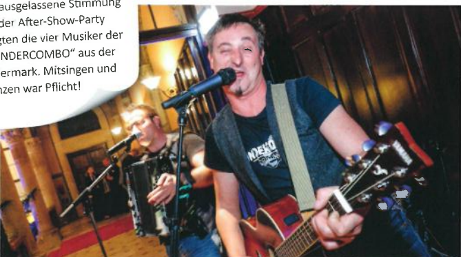
Für ausgelassene Stimmung bei der After-Show-Party sorgten die vier Musiker der „SONDERCOMBO“ aus der Steiermark. Mitsingen und -tanzen war Pflicht!